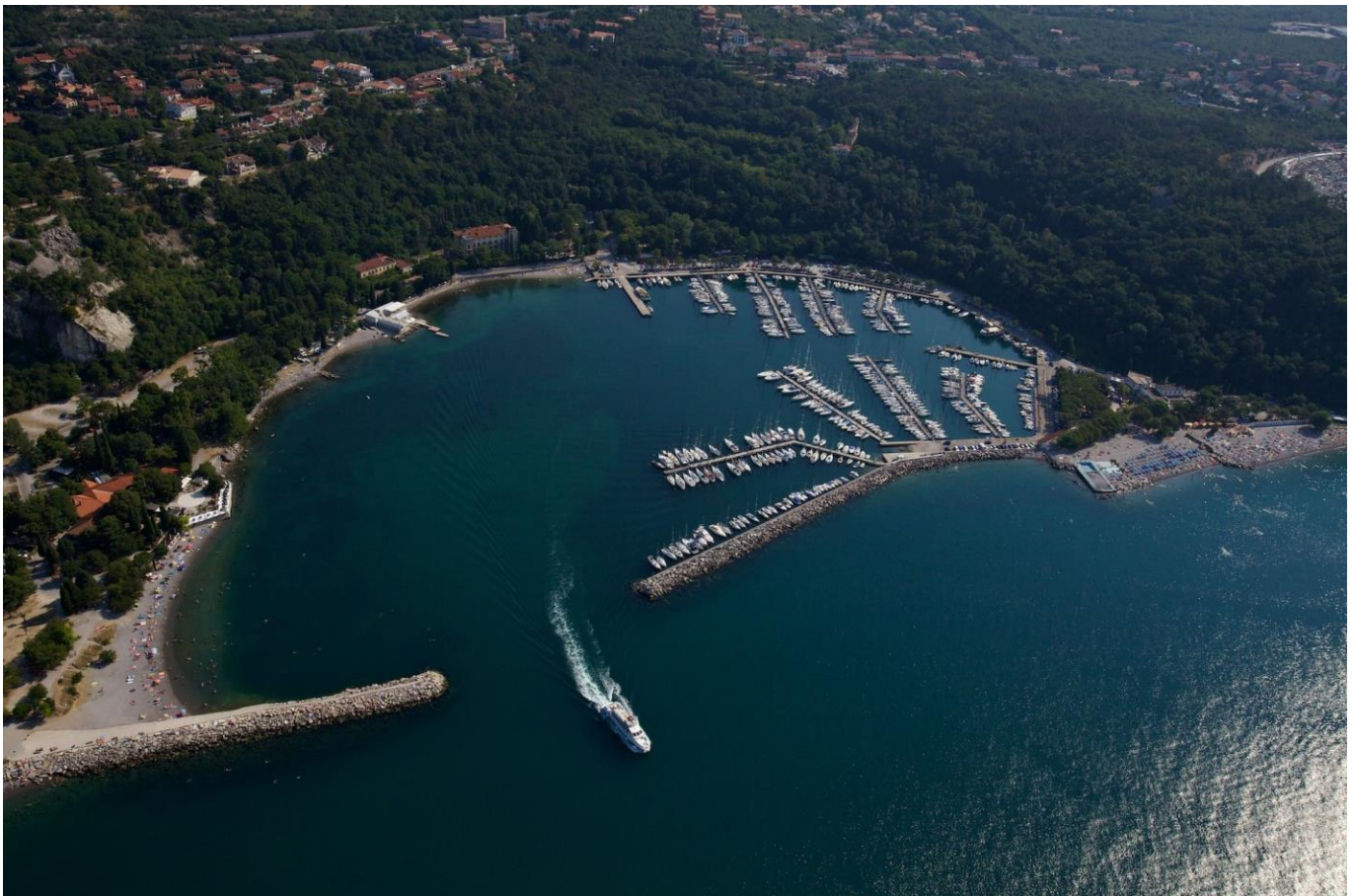
BAIA DI SISTIANA